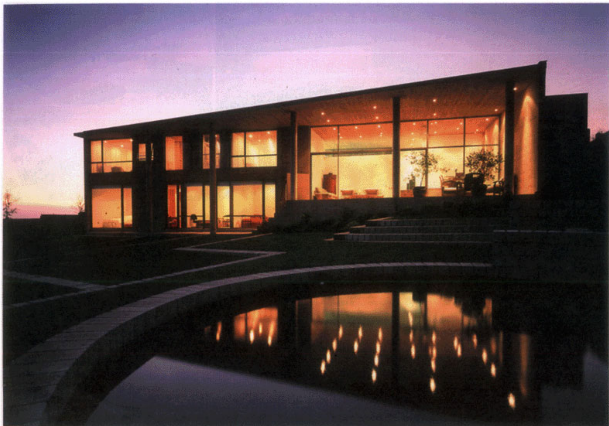
La casa El Mirador, en Los Dominicos, aparece cerrada hacia la calle y completamente abierta a la cordillera.